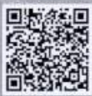
รายชื่อโรงพยาบาล ที่รับบริจาคโลหิต