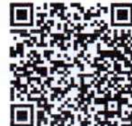
(รายงานการสำรวจพื้นที่)